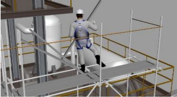
足場組立時の墜落災害