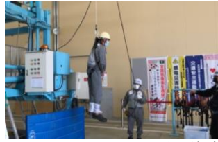
フルハーネスぶら下がり体感