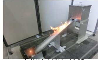
有機溶剤燃焼模擬